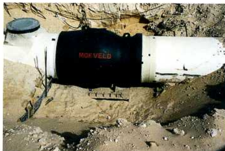
Безударный обратный клапан 56" ANSI 600, трубопровод питьевой воды, Саудовская Аравия