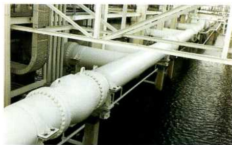
Безударный обратный клапан 42" ANSI 300, нефтехранилище, США

Фирма Моквелд поставляет свои обратные клапаны на крупнейшие в мире трубопроводы нефти и воды, системы транспорта, хранилища, станции сжижения природного газа, установки переработки олефинов. Обратные клапаны Моквелд используются всеми крупнейшими нефтяными и газовыми компаниями, химическими предприятиями и компаниями водоснабжения.