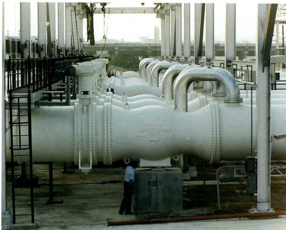
Безударные обратные клапаны 72" ANSI 175 на нагнетании насоса водоохлаждения установки сжижения природного газа, Малайзия